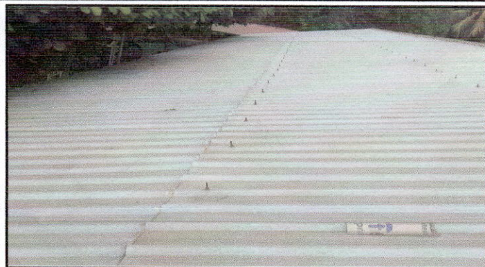
Foto1: Sustitucion de lamina por lamina troquelada calibre 26