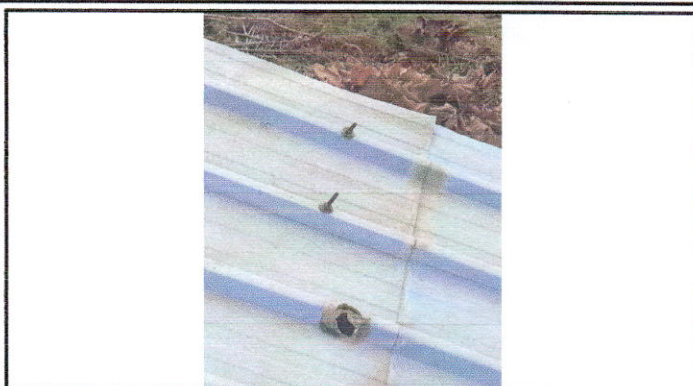
Foto2: Sustitucion de lamina por lamina troquelada calibre 26